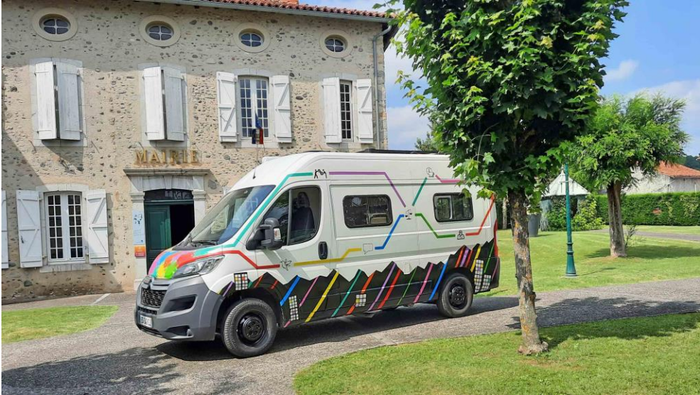
Camion de l'insertion DT31/09/65