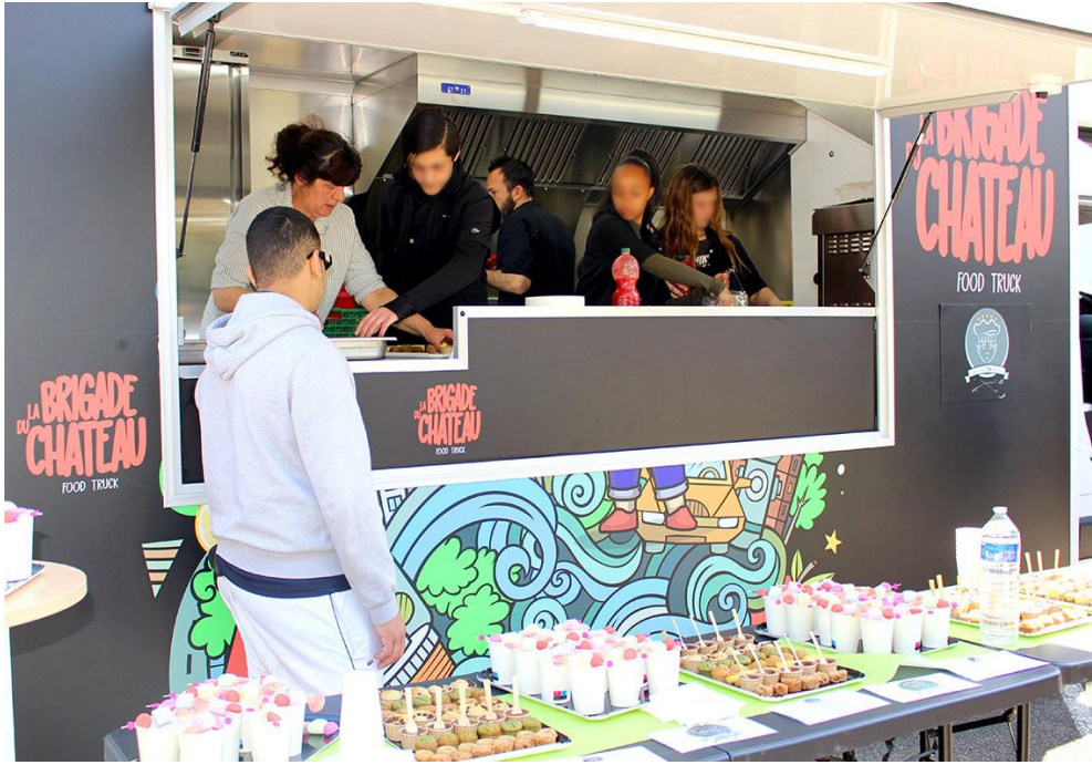
FOOD TRUCK La Brigade du Chateau DT34 STEi Montpellier