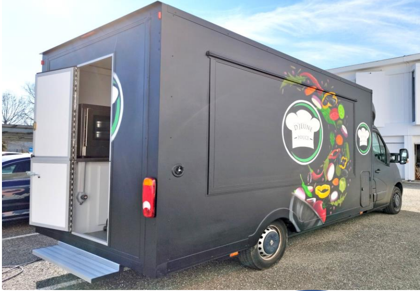
FOOD TRUCK D'jeune pouce DT31/09/65 STEi Toulouse